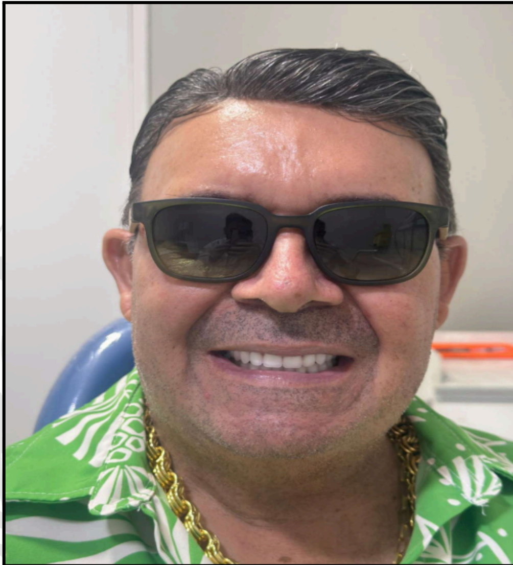
Figura 2, Vista frontal no dia da entrega

As fotografias abaixo, registradas no dia da entrega, demonstram com clareza a excelente qualidade das próteses e a ótima adaptação obtida, especialmente na prótese superior: